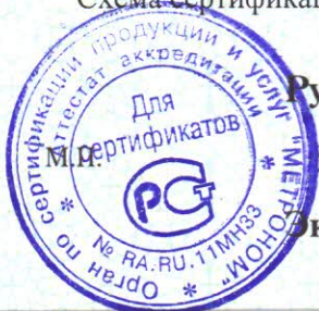
Схема сертификации – 1с

Место нанесения знака соответствия: на изделия и в товаросопроводительной документации.