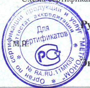
Схема сертификации – 1с

Место нанесения знака соответствия: на изделия и в товаросопроводительной документации.